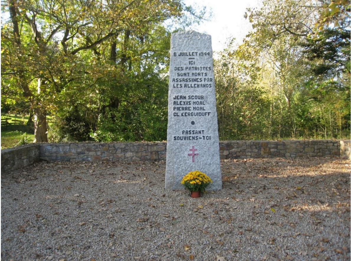
Stèle de Pontplaincoat à Plougasnou

C'est sous cette stèle que son corps fut retrouvé le 19 août 1944.