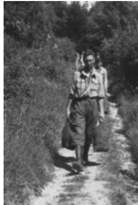
Coll. Mémoire de la Drôme Alias "Jacquelin"