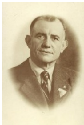
Coll. AGFBL, DR Alias "Raymond"